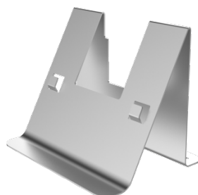
DS-KAB21-H Support de bureau